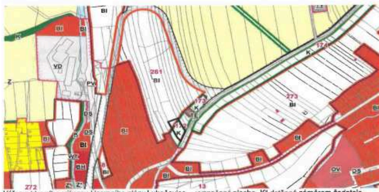
Výřez z hlavního výkresu Územního plánu Luhačovice – vyznačená plocha „K“ dotčená záměrem žadatele