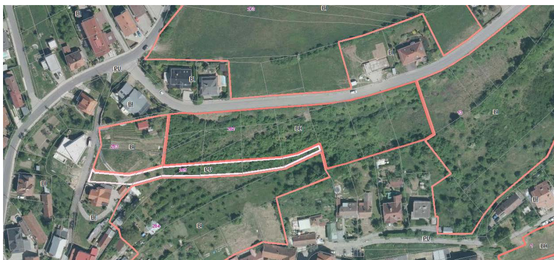
Územní členění ploch s rozdílným způsobem využití – navrhované plochy BH č. 282 a PU č. 285

S ohledem na podrobné prověření územní studií je požadována pro plochu č. 282 tato regulace s prvky regulačního plánu: max. 7 terasových bytových domů s max. 2 NP a plochou střechou, stavební čára domů rovnoběžných se Slunnou ulicí bude 10 a 11 m.