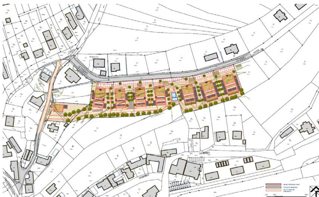
Plošné řešení zástavby sedmi bytových domů v ploše BH č. 282