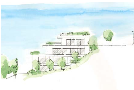
Řez a pohled - uvažovaná výstavba terasových bytových domů